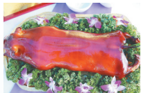
四更烤乳猪 (张家老字号)