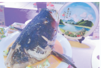
黄焖广坝鱼头 (东方迎宾馆)