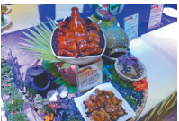
东方古法焖香猪 (紫荆花大酒店)