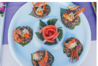
黎香米蒸膏蟹 (三沙湾海鲜坊)