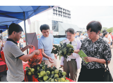
市民在现场采购农产品。

本报八所9月29日电（见习记者肖开刚 刘婧姝）中秋国庆佳节未到，东方市已先热闹了起来。9月29日上午，东方市2020年农民丰收节暨迎中秋庆国庆活动在东方市民休闲广场举行。活动现场人头攒动，丰富诱人的特色美食、精彩纷呈的趣味活动，让所有人的脸上都洋溢着丰收的喜悦，提前感受到了中秋国庆佳节的喜庆氛围。