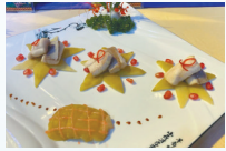
东方沙鱼焖酸瓜 (福兴谷农庄)