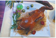
香茅百鹭鸭 (西岛红美食美容)