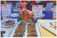
东方盐焗羊 (清源饭店)