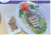
三层肉蒸梅香鱼粽 (百来顺美食城)