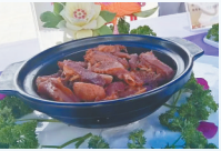
红焖红兴鹅 (天鹅湖饭店)