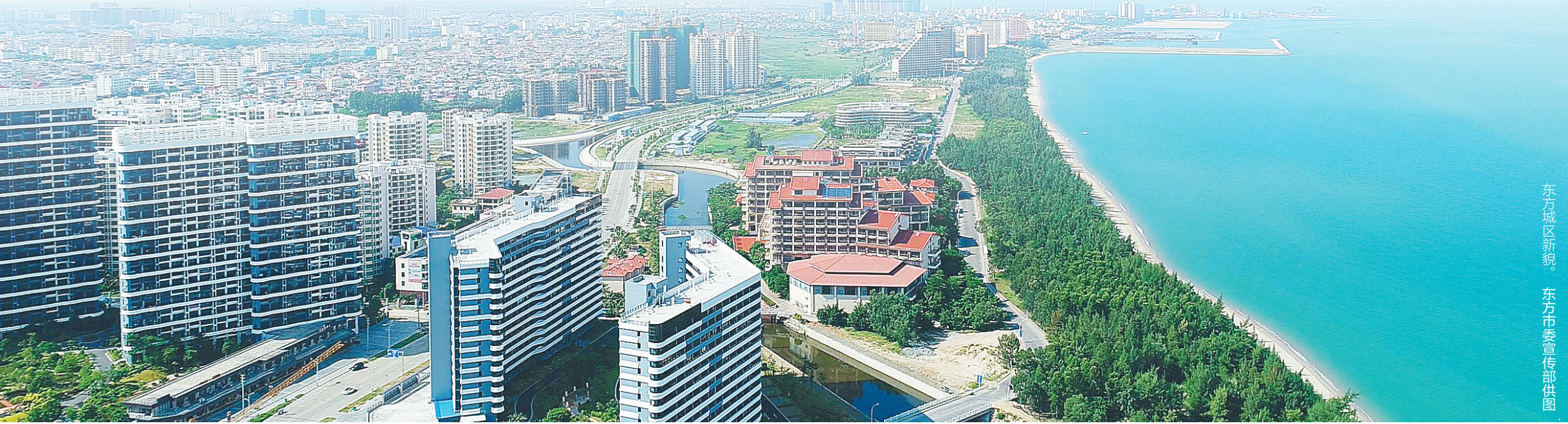
东方城区新貌。