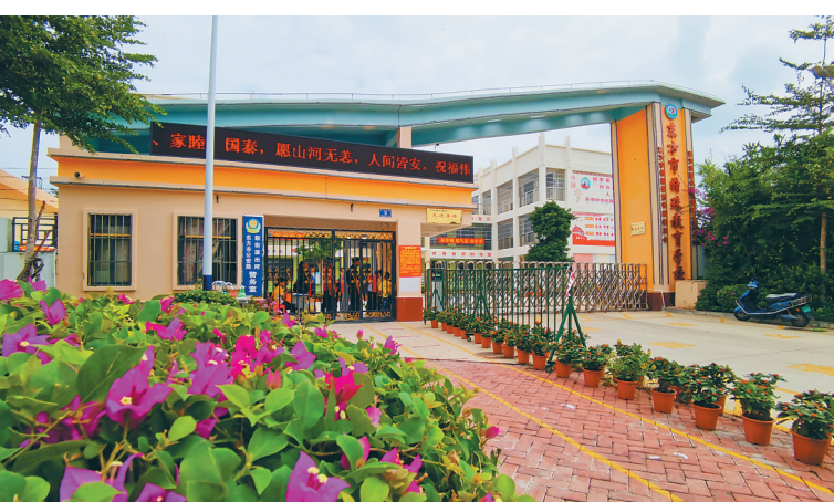
东方市特殊教育学校。