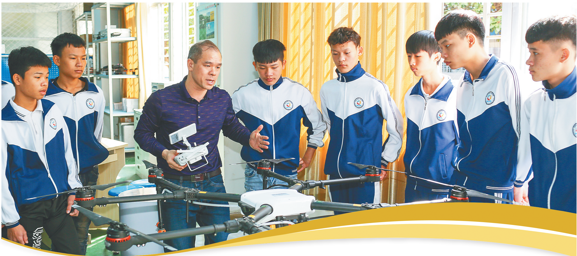
海南省机电工程学校职业初中班的部分学生在老师的指导下了解无人机。去年九月,我省在部分中职学校试点设立职业初中班,建档立卡贫困户子女完成义务教育教育,并掌握一技之长。