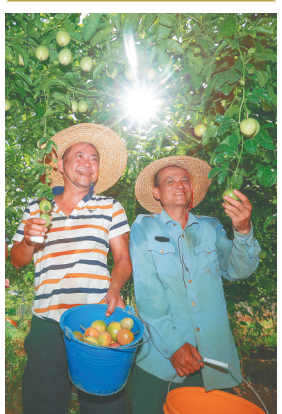
在位于万宁市南桥镇南林居的海南农垦东新农场公司南林百香果种植示范基地里,工人们在展示百香果。

脱贫成果丰硕,离不开干部群众的共同努力。万宁市委市政府认真贯彻落实中央、省委相关部署,从打造脱贫产业,激发脱贫群众内生动力,引进脱贫项目等方面发力,全面推动精准扶贫,围绕“两不愁、三保障”,下足“绣花”功夫。