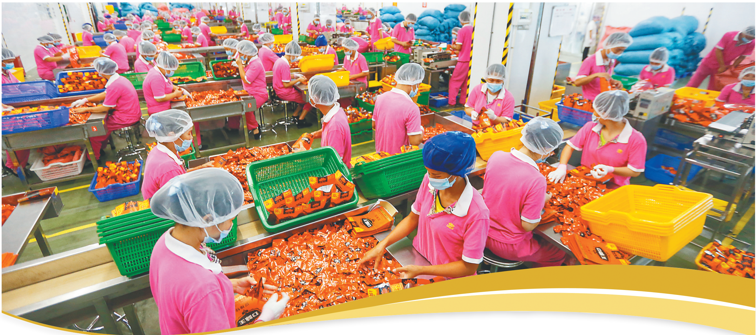
在位于万宁的海口味王科技发展有限公司的生产车间,工人在各自岗位上忙碌着。