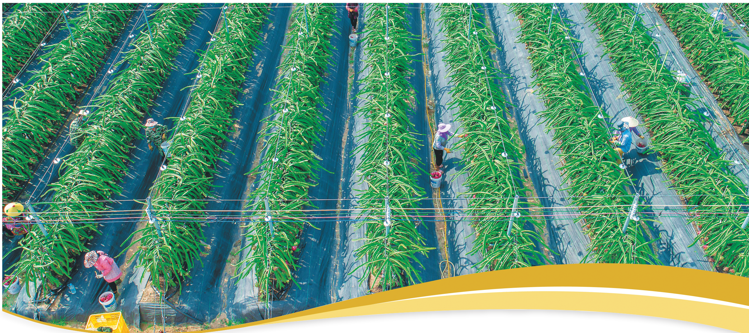
在乐东黎族自治县利国镇华翔火龙果基地，农户们忙着采摘火龙果。