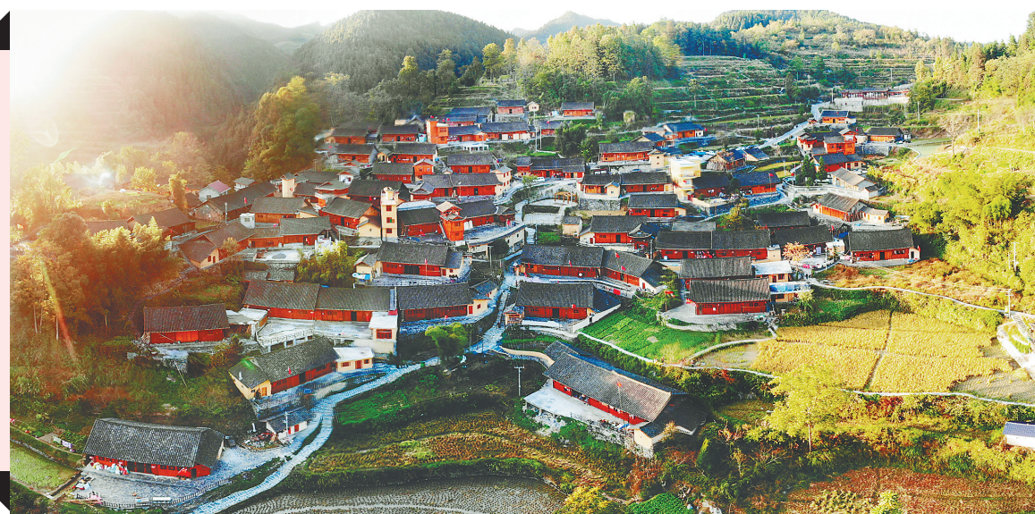
图为湖南省花垣县十八洞村。