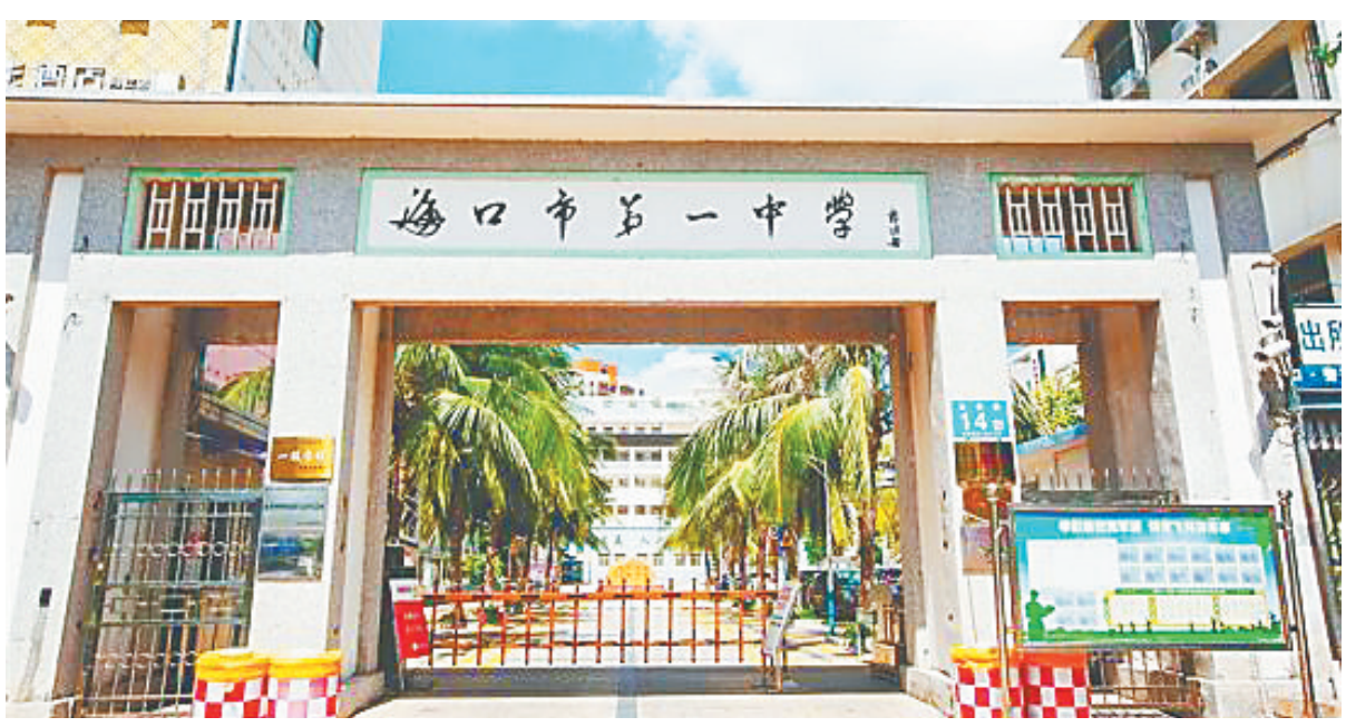
郭沫若题校名的海口第一中学。

1962年，郭沫若再一次来到海南，这一次，吸引他来的不仅仅是海南美丽的热带风光，还有海南悠久的历史。郭沫若这次来海南是带着任务的，他要到那部已经被虫鼠咬破不堪的《崖州志》进行点校，以便人们更好地了解海南的历史。故地重游，郭沫若又来到了一年曾经游览过的天涯海角，去年在此地，郭沫若为“天涯海角游览区”题辞，还帮助渔民拉过网。而这次重游天涯海角，郭沫若则更是为了给这一风景名胜正名。相传，“天涯”二字乃是苏东坡所提，但是在熟读史书并深谙书法的郭沫若看来，这只不过是传说，苏