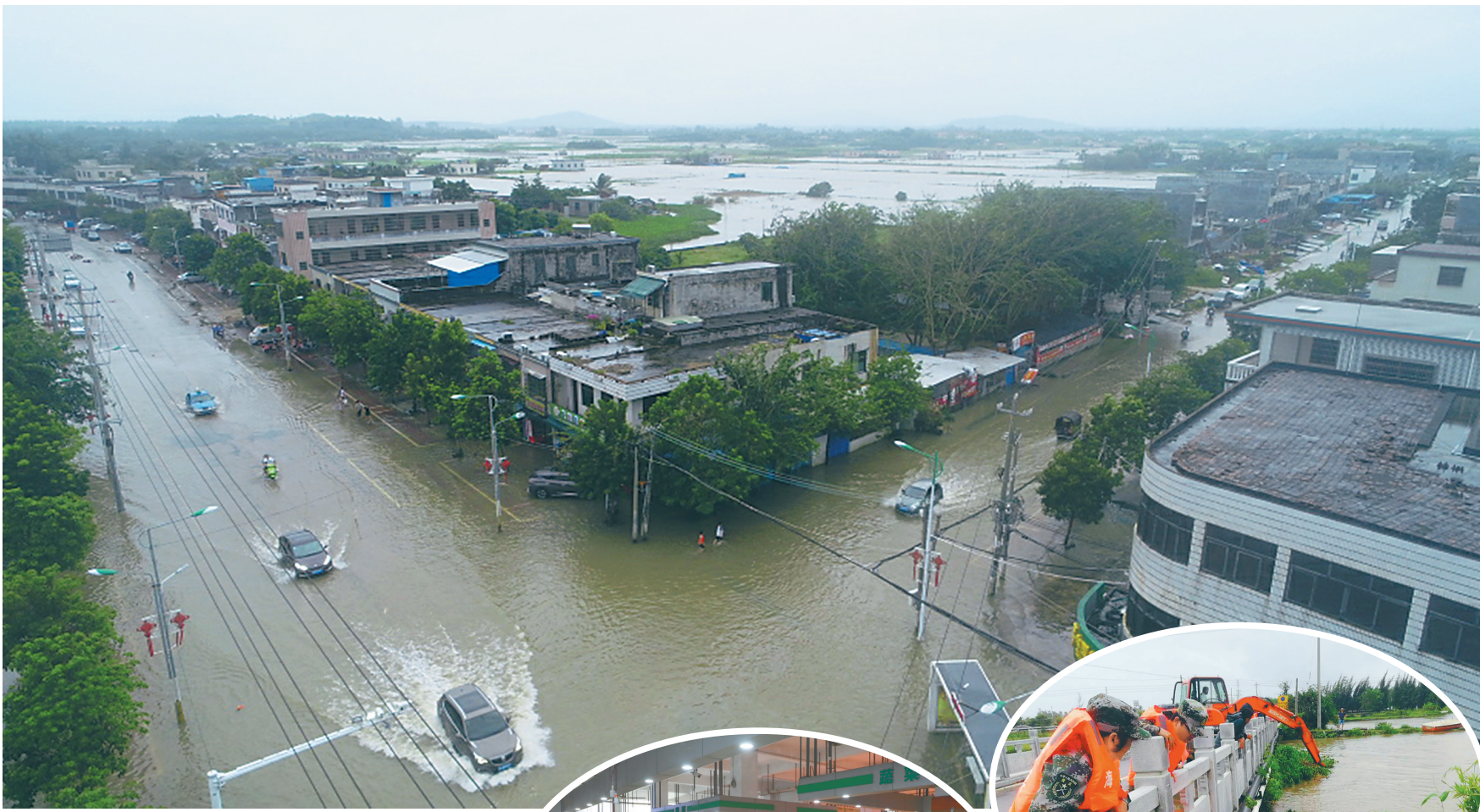
↑10月18日，在万宁市万城镇的北坡邮政银行附近，车辆驶过积水路段。