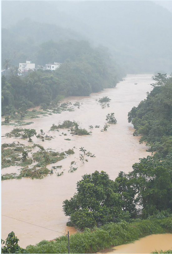
10月18日，在琼中黎族苗族自治县红毛镇罗虾村，昌化江涨水淹没出村道路。