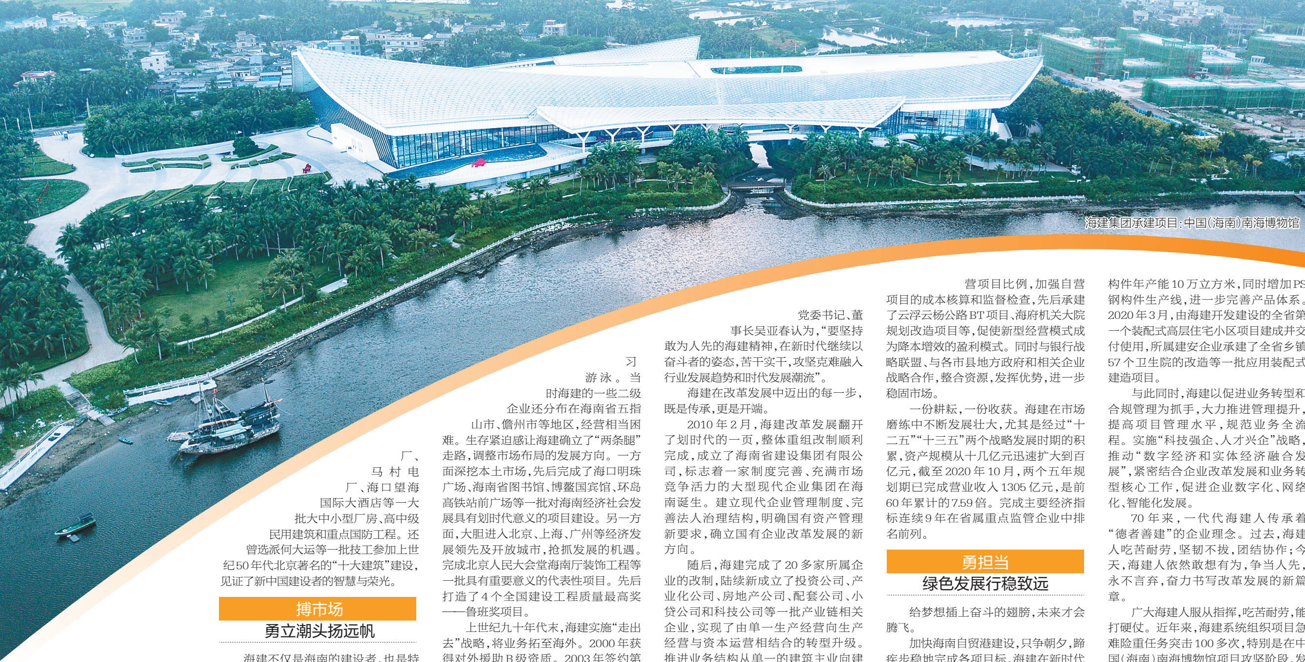
海建集团承建项目：中国(海南)南海博物馆

营项目比例，加强自营项目的成本核算和监督检查，先后承建了云浮云杨公路BT项目、海府机关大院规划改造项目等，促使新型经营模式成为降本增效的盈利模式。同时与银行战略联盟、与各市县地方政府和相关企业战略合作，整合资源，发挥优势，进一步稳固市场。