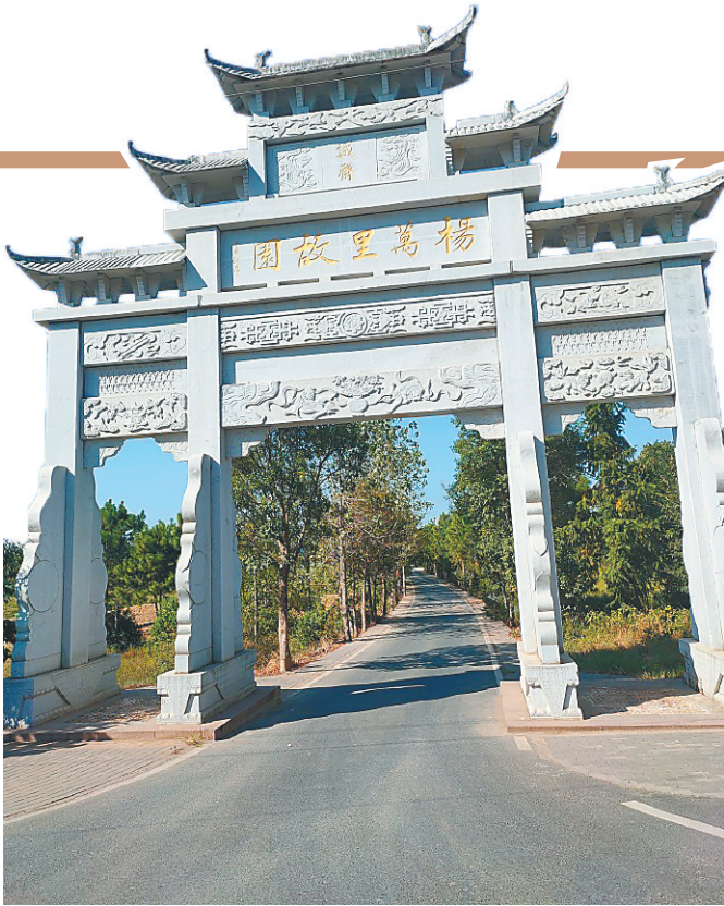
位于江西省吉安市吉水县的杨万里故居。

作为诗人，杨万里创造了语言浅显、清新自然、富有幽默情趣的“诚斋体”。他的作品被收入《诚斋集》，共有133卷之多。与杨万里同时代的姜特立如此赞许：“今日诗坛谁是主，诚斋诗律正施行。”项安世也评点道：“四海诚斋独霸诗。”千百年来，杨万里的诗作经过了长时间的检验，至今仍有不少作品脍炙人口。