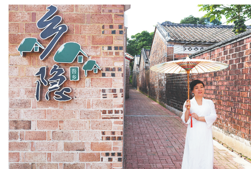
游客在文昌市潭牛镇大庙村“吾乡·乡隐”民宿门口拍照。