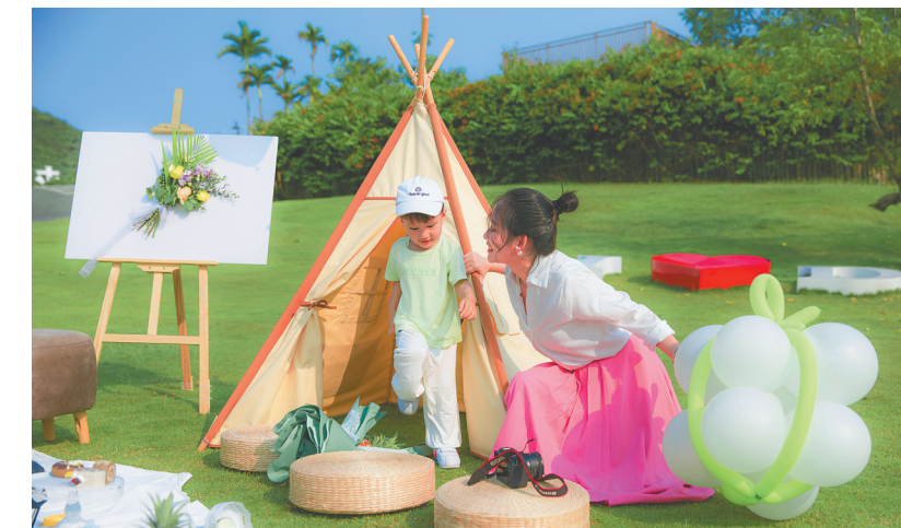
游客在三亚市吉阳区大茅村游玩。近年来,大茅村建设现代农业产业园,共享农庄,走农旅融合发展之路。