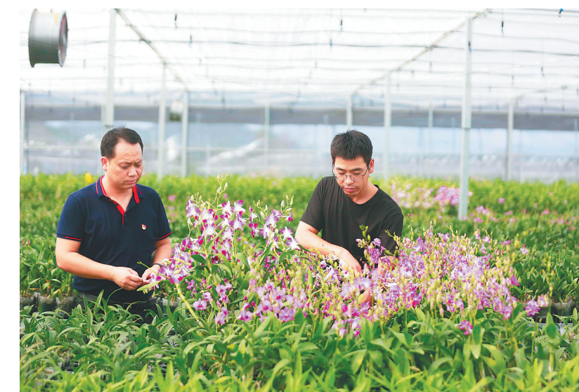
东方市板桥镇新园村发展兰花种植产业,村集体经济态势良好。