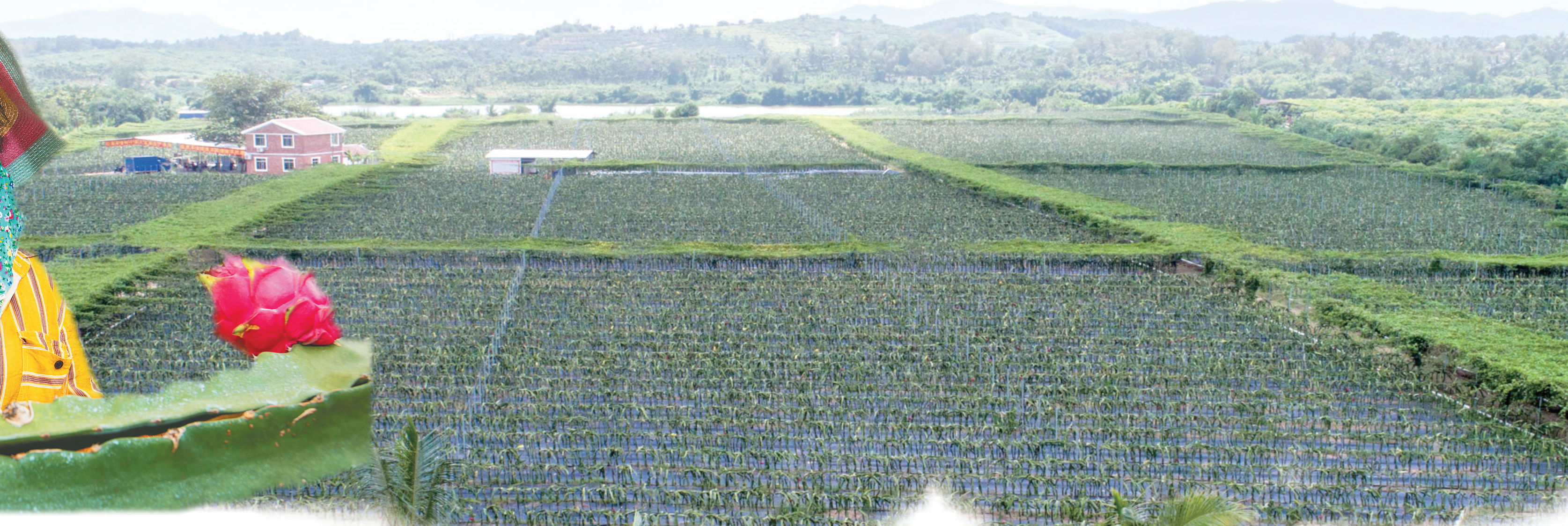
陵水黎族自治县本号镇军普村成立村集体公司发展火龙果产业。图为军普村火龙果种植基地。