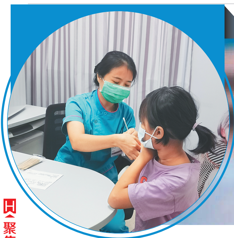
我省第一针国产二价HPV疫苗在海南省妇女儿童医学中心开始接种。