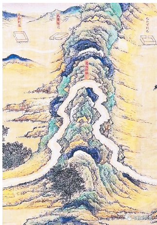
《丝路山水地图》局部

自明永乐十八年(1420)建成至今,紫禁城经历了六百年历史的风霜雪雨。它曾是权力的象征,是“纪念碑”式的宏大建筑群;见证了帝制的终结后,它从帝王的宫苑变身为大众博物馆——1925年10月10日,故宫博物院成立。今年,我们迎来紫禁城落成600年,也迎来故宫博物院成立95周年。在时光流逝中,紫禁城的故事一直为人津津乐道,而拥有众多珍品的故宫博物院也往往让人流连忘返。