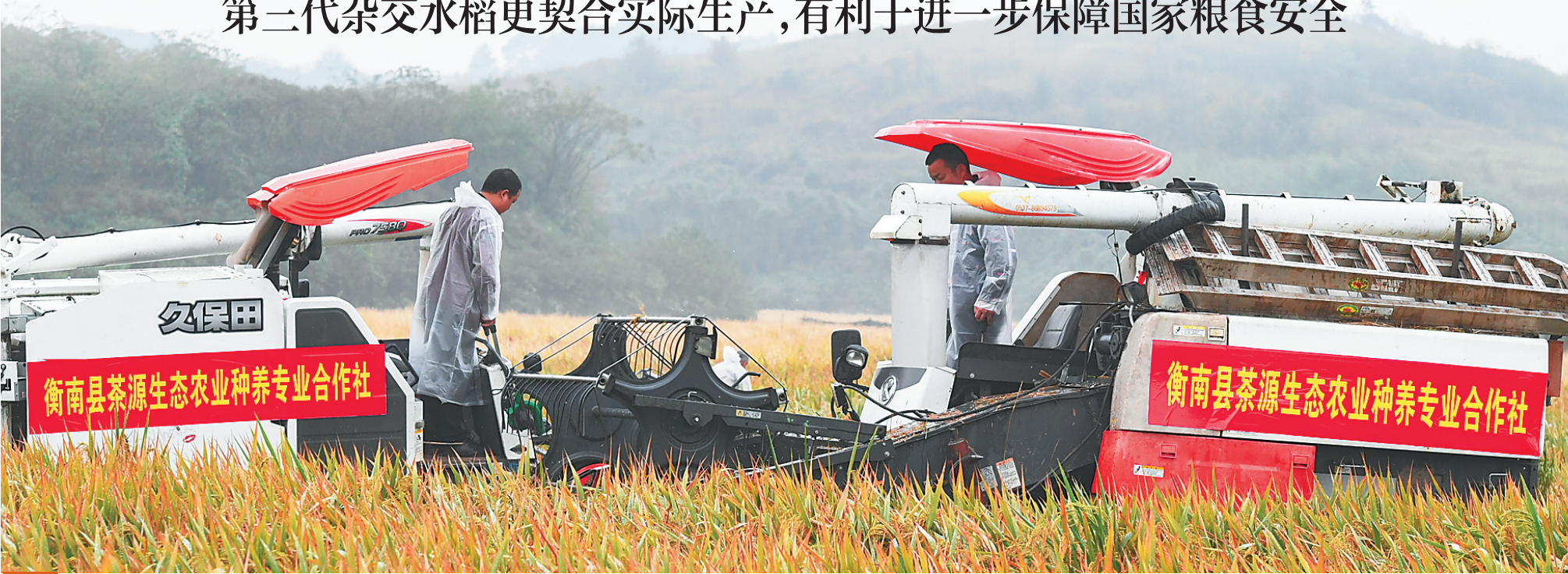
11月2日,在第三代杂交水稻“叁优一号”衡南试验示范基地,工作人员进行机械化收割。

11月2日在湖南省衡阳市衡南县清竹村进行的袁隆平领衔的杂交水稻双季测产达到了亩产1530.76公斤,其中早稻619.06公斤、第三代杂交水稻晚稻品种“叁优一号”911.7公斤,超过了1500公斤的预期目标。比数字更重要的意义在于:这次测产充分展示了第三代杂交水稻更加契合实际生产的特点,从而有利于进一步保障国家粮食安全。