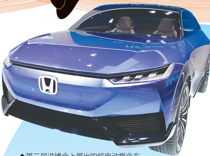
↑第三届进博会上展出的纯电动概念车。

↓11月5日，在第三届进博会技术装备战区，“欧姆龙”乒乓球教练机器人与观展嘉宾进行互动。