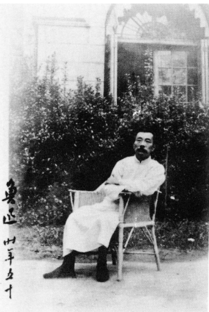
鲁迅五十岁生日纪念照。

鲁迅给人的印象近乎冷峻，一副凛严的面孔像一张不会动的铁板，目光也总像一把利剑，在那样的乱世中穿行。在这样的模式下鲁迅的作品，越读越觉得鲁迅是一个硬骨头，一张口说出的话，总带着一股寒气。其实，生活中真实的鲁迅并不完全是这样。从下面一个个小故事，我们可以看出，鲁迅又是那么的可爱，那么的逗，那么的富有生活情趣。