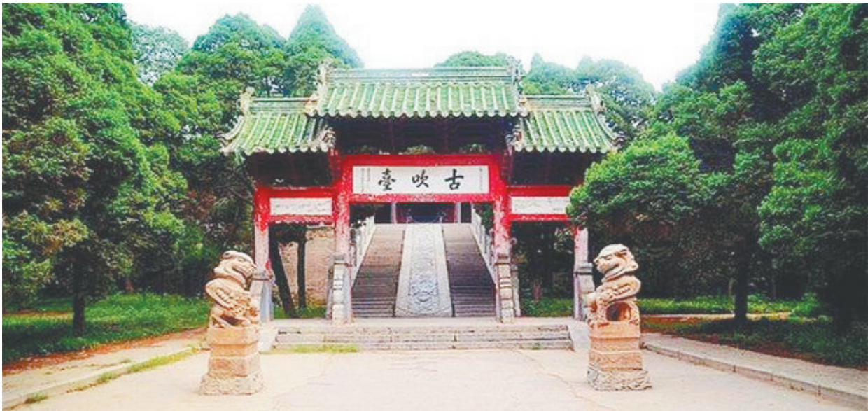
河南开封古吹台，李白与杜甫、高适曾在此携手同游。