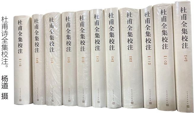
杜甫诗全集校注。