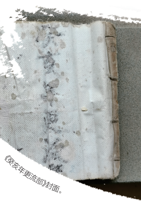
《癸亥年更流部》封面。