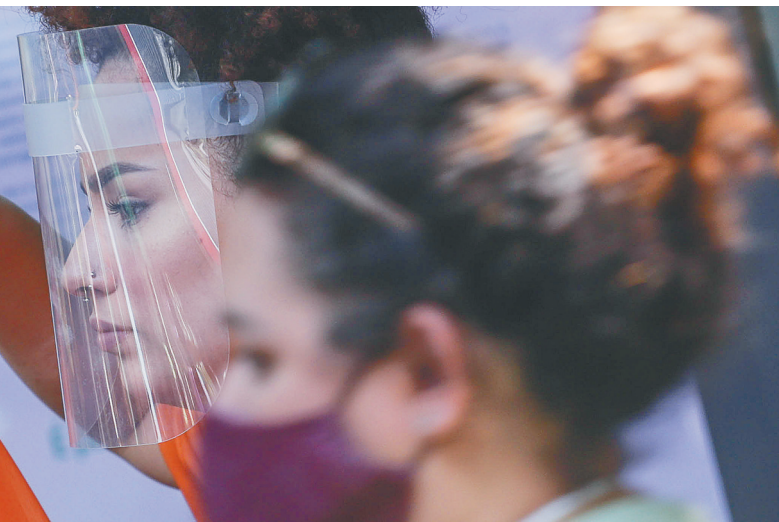
在巴西圣保罗市，行人戴面罩出行。