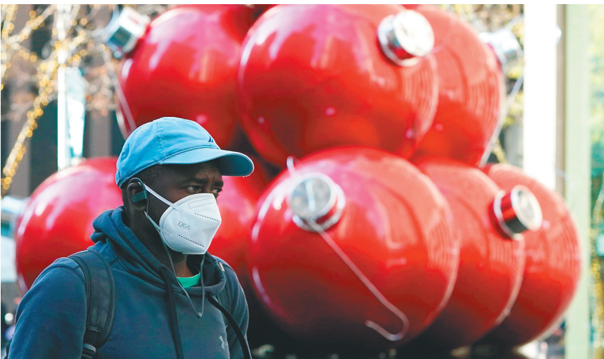
一名戴口罩男子走过纽约一处圣诞装饰。