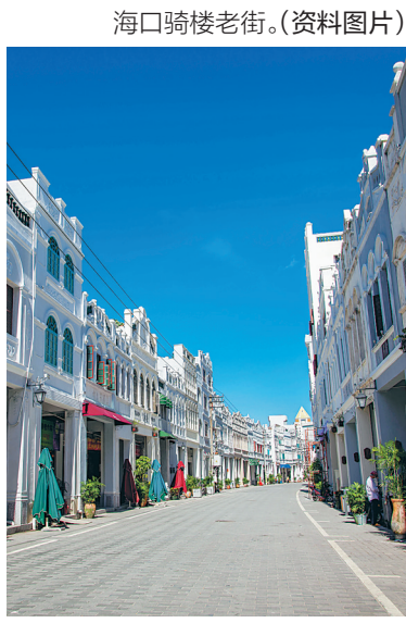
海口骑楼老街。（资料图片）

步行街的改造升级是政府主导、多主体参与的系统工程，涉及道路规划、资源聚集、设施建设、管理创新等多方面举措。外国学者多从地理学、心理学的角度探索影响步行街发展的因素，提出以地理信息系统确定选址、提高街区环境和店铺形象、差异化消费和有效宣传等策略。国内研究起步较晚，多为战略性研究与案例分析，从区域经济的角度分析建设的功能定位、规划布局、管理经营与方针政策。综合已有研究成果与海南省步行街实际发展情况，本文提出以下具体举措。 优化街区环境，完善基础设施。在开发步行街过程中，应着重打造周