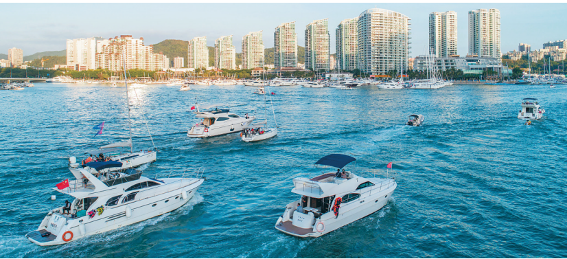
近年来，三亚游艇游不断受捧。图为三亚港游艇。

两年多来，海南以旅游业、现代服务业和高新技术产业为重点，推动自由贸易港建设实现顺利开局。2019年，海南共接待国内外游客8311.20万人次，实现旅游总收入1057.80亿元，海南旅游业正式迈入千亿元产业行列。作为海南千亿级产业之一的旅游业，培育形成了海洋旅游、康养旅游、文化旅游、体育旅游、会展旅游、购物旅游、森林旅游、小镇旅游、乡村旅游、婚庆旅游等10大旅游产品体系，科技旅游、航空旅游、房车旅游等旅游新业态不断发展，离岛免税购物、跨省团队游等利好不断释放。 按照《海南自由贸易港建设总体方案》《海南省建设国际旅游消费中心的实施方案》要求，“十四五”期间，海南旅游将坚持新发展理念，坚持高质量发展要求，坚持走全域旅游的路子，加快供给侧结构性改革，推进“旅游+”融合发展；对标世界级旅游度假目的地，创新培育独具海南特色的国际旅游消费产业链，紧扣海南自由贸易港政策制度集成创新，加快建设国际旅游消费中心。在发展理念上，着力突出特色化、国际化、高端化、全域化、标准化、智能化。在空间布局上，在“海澄文一体化综合经济圈”和“三亚旅游经济圈”引领下，推进全省六大板块旅游差异化发展，形成“南北两极带动、东西两翼加快发展、中部地区绿色崛起、海洋旅游全面升级”空间格局，引导旅游空间协调发展，优化全域均衡发展，着力解决旅游发展“不平衡不充分”问题。 一、做好顶层设计，打造品牌核心竞争力 产业和社会旅游市场发展的体制机制应从业长计议，通过顶层设计调动社会资源，出台产业扶持政策、支持航线开发、整合促销、提升国际化服务等元素缺一不可，一切促成创新工作都要围绕做大做强产业进行。 目前，海南凭借独特的地理优势，国内市场迅速恢复，我们要利用好这次疫情带来的“危中之机”，加大供给侧结