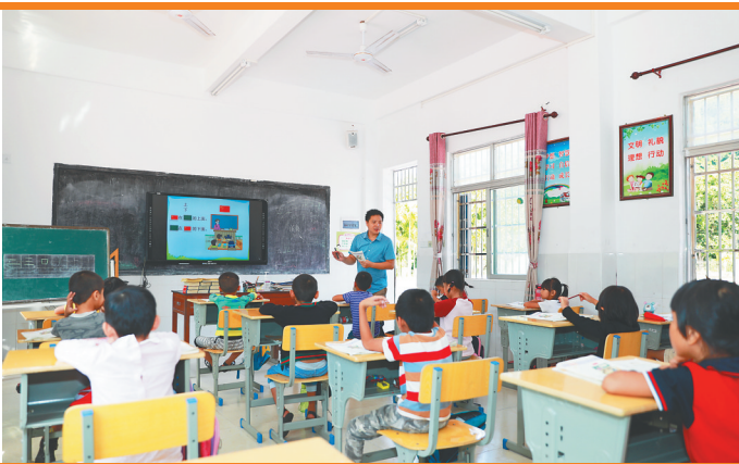
在南圣镇同甲村，小学教学点的数学老师为学生上课。