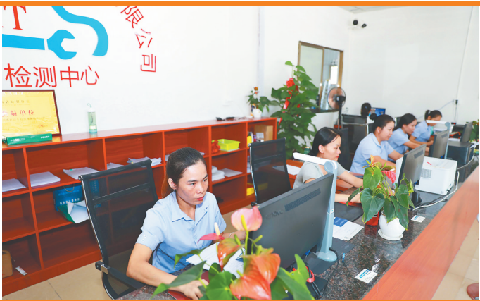
机动车检测公司开在毛道乡毛道村，吸纳村里12名村民就业。