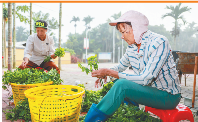
南圣镇同甲村发展树仔菜产业，带动村民增收。