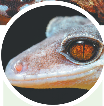
周氏睑虎。

地球上从没有任何生物能像爬行动物一样，一度称霸整个海陆空世界。它们曾统治地球长达数亿年之久，不料却于“白垩纪—古近纪灭绝事件”中惨遭灭顶之灾，仅剩一些小型且坚强的爬行动物存活至今——在世界自然保护联盟濒危物种红色名录上，有三分之一的爬行动物被登记为易危、濒危，甚至极度濒危。