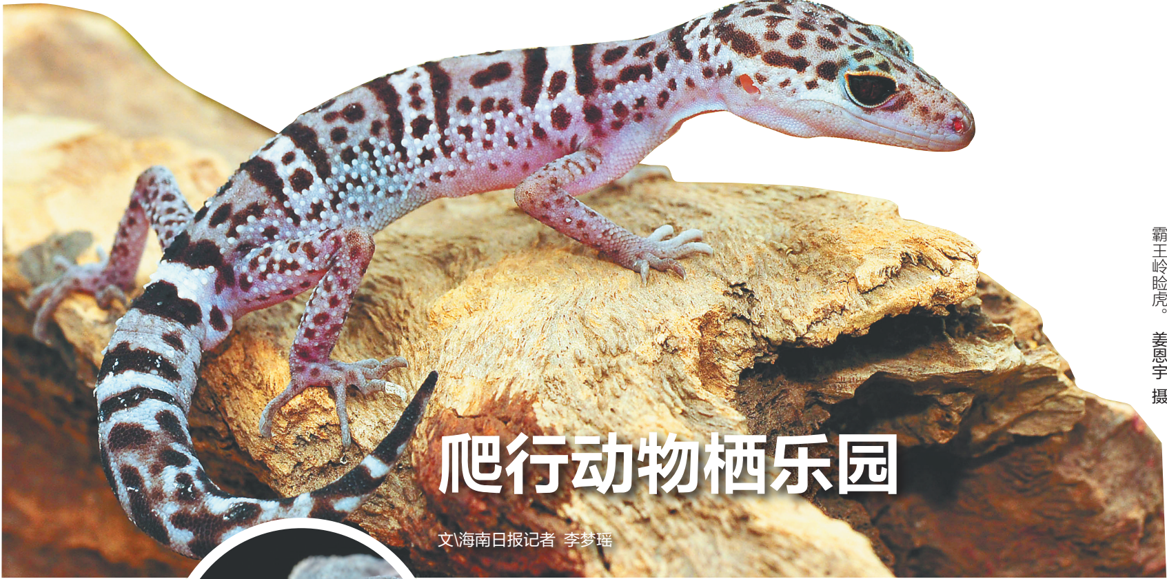
霸王岭睑虎。姜恩宇 摄