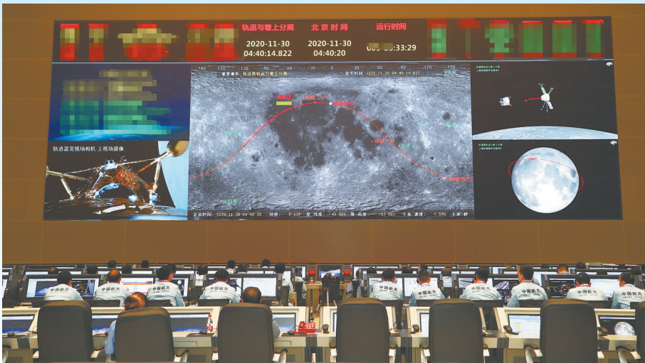
11月30日，航天科技人员在北京航天飞行控制中心专注工作。