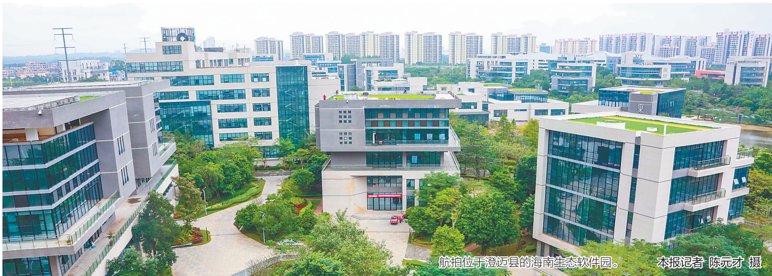
航拍位于澄迈县的海南生态软件园。