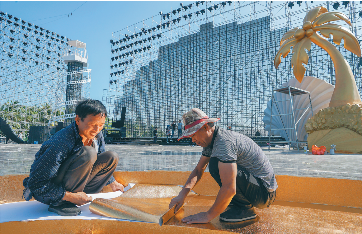
12月3日，在三亚市海棠广场，施工人员正在加紧布置第三届海南岛国际电影节开幕式舞台。

据了解，本届电影节12月5日举行开幕式红毯和开幕式晚会，12月12日举行闭幕式红毯和闭幕式晚会。为期8天的电影节每天都有精彩活动，将打造全新电影市场概念，活动流程安排H! Future新人荣誉、H! Action创投会、H! Market市场放映、H! Market新片速递、H! Market网络电影周、H! Market取景地国际推介会六大版块，并举行海南自由贸易港电影促进高峰论坛、法国电影展、H! Market取景地国际推介会、全岛电影展映等特色活动，构建产业多元交流平台，实现全产业链贯通，助力海南打造新兴的国际化电影市场。