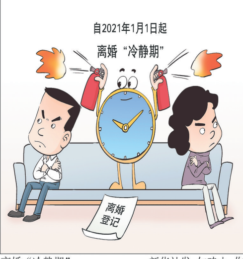
离婚“冷静期” 新华社发 勾建山 作

针对社会关注的“冷静期规定是否不利于保护受家暴当事人”等问题，民政部社会事务司有关负责人表示，冷静期只适用于夫妻双方自愿的协议离婚，对于有家暴情形的，当事人可以向法院提起诉讼，诉讼离婚并没有冷静期的规定。