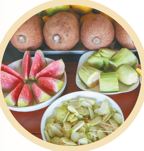
位于琼海大路镇的海南盛大现代农业开发有限公司热带水果优良品种引进与示范基地,培育了多种热带水果新品种。