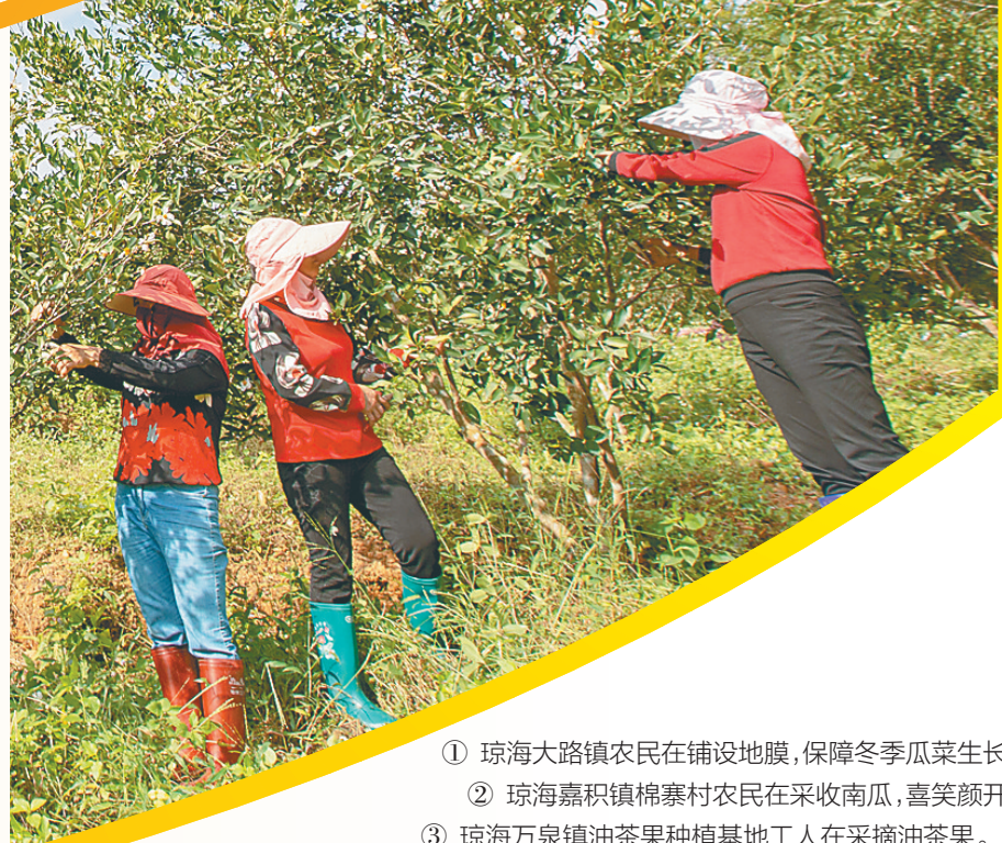
① 琼海大路镇农民在铺设地膜,保障冬季瓜菜生长。