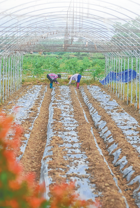
琼海博鳌龙潭洋农业公园,农户在田间地头忙碌。