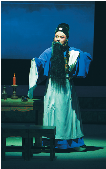
琼剧舞台上的海瑞形象。