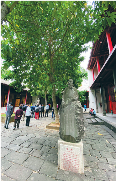
海口市五公祠纪念的李光是浙江人氏。