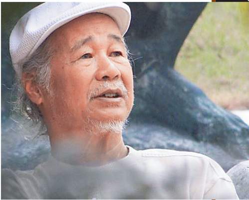
潘鹤。 (本版照片均为资料图片)