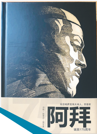
阿克拜尔译著《阿拜》