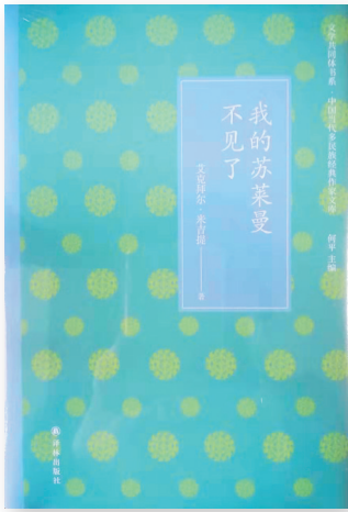
阿克拜尔作品集《我的苏莱曼不见了》

“能够来海南参与评审,对我来说是非常爽快的一件事,让我体会到了海南的文化自信。”11月28日,中国作家协会影视文学委员会副主任、中国电影文学学会常务副会长,《中国作家》原主编阿克拜尔·米吉提专程从北京飞抵海口,担当由省民宗委与海南日报社联合主办的海南省民族文化“七个一”作品征集评选活动(以下简称“七个一”活动)评审会总顾问。