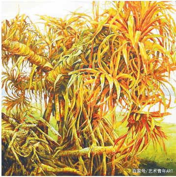
周铁利油画作品《盛夏的野菠萝》

他创作的《生命阳光》《绿的音符》《盛夏的野菠萝》《多彩的阳光系列》《三角梅系列》《红树林系列》《热带雨林奏鸣曲》等作品,合理吸收西方的色彩观念,突出色彩,强化光感,表现光感在热带雨林植物中的微妙变化。并尽量利用纯色,加强色的对比。强调色彩的质量感和材料属性,强化光的照射和传统