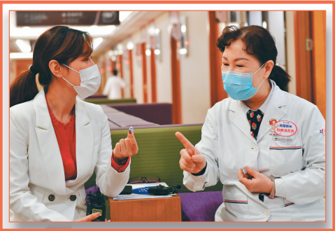
《大医精讲》第四期直播现场