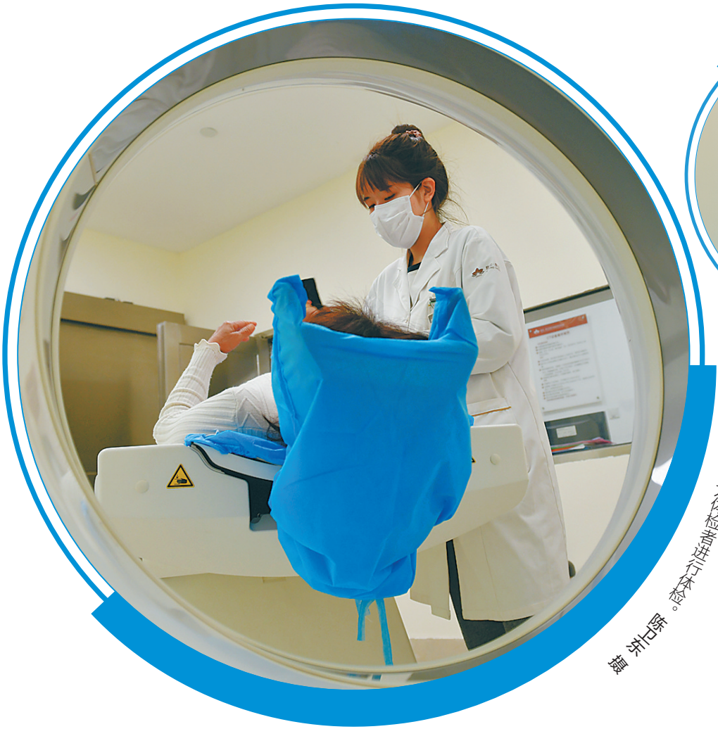
医护人员在为体检者进行抽血检测。