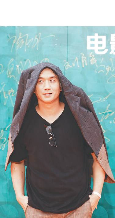
演员黄觉用衣服披头走红毯。