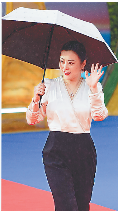
演员郝蕾向影迷挥手致意。

龙形状气球缓缓入场，到达影迷区时将气球送给了观众。该影片主演黄轩担任第三届海南岛国际电影节青年电影大使，他表示，这是自己第一次参加