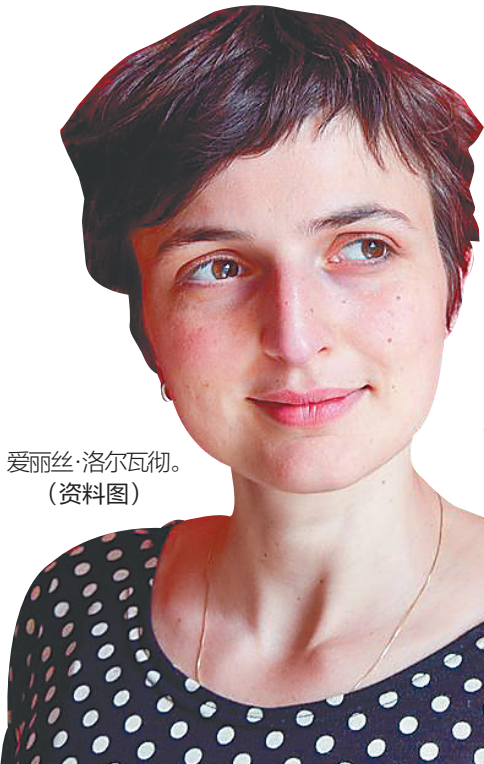
爱丽丝·洛尔瓦彻。(资料图)