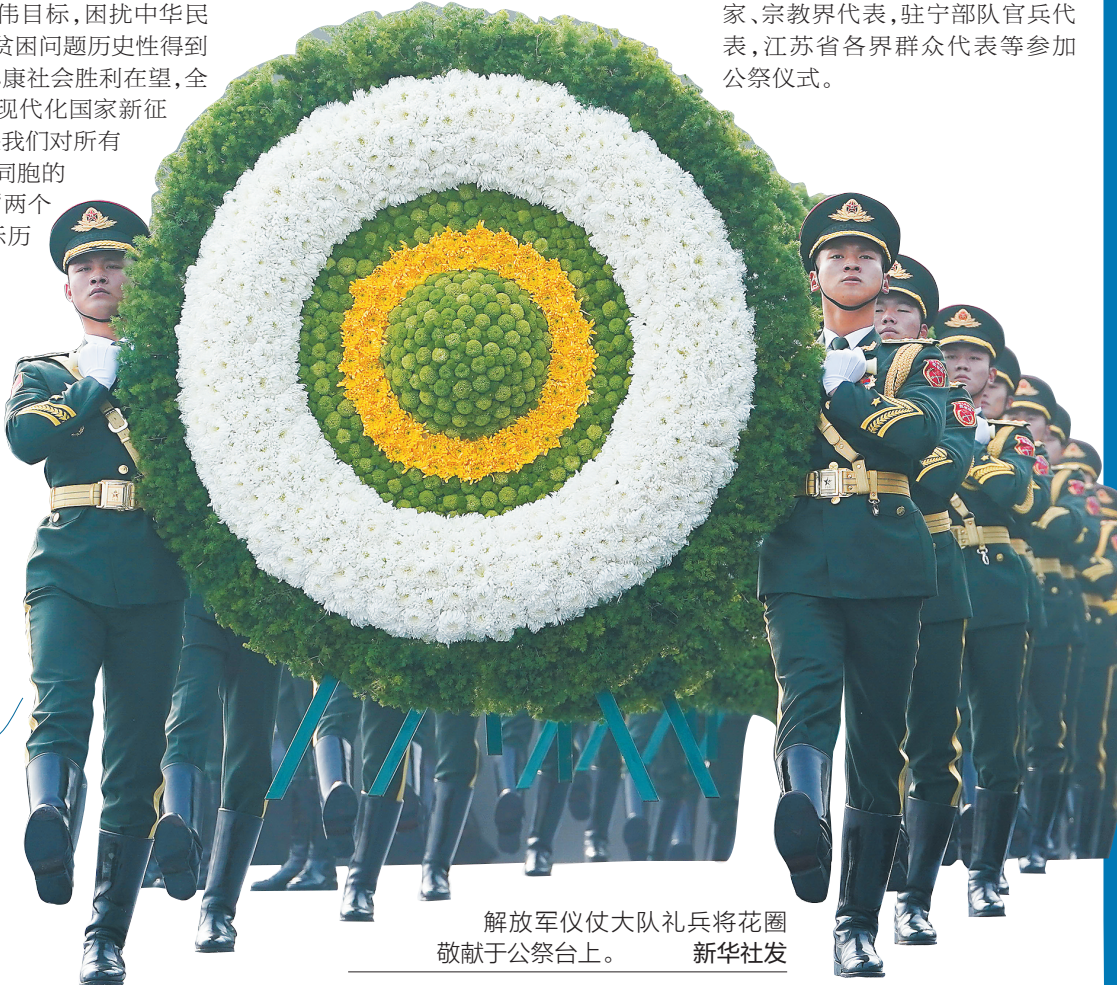
解放军仪仗大队礼兵将花圈敬献于公祭台上。

2014年2月27日，十二届全国人大常委会第七次会议通过决定，以立法形式将12月13日设立为南京大屠杀死难者国家公祭日。（据新华社电）