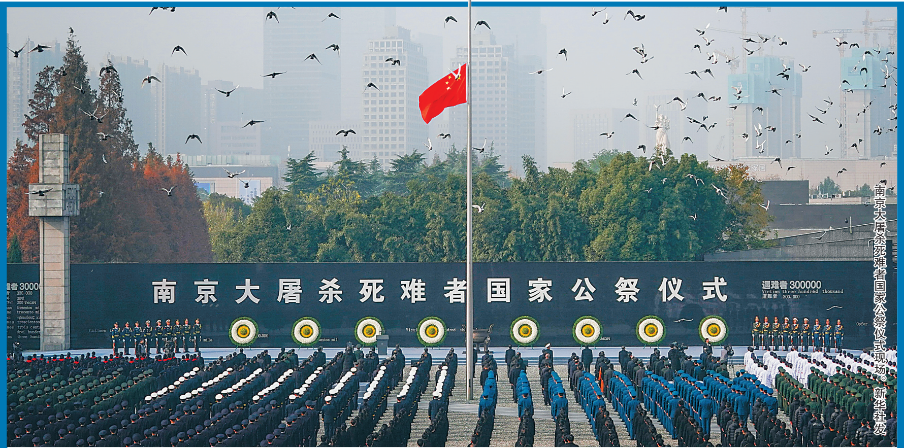
南京大屠杀死难者国家公祭仪式现场。