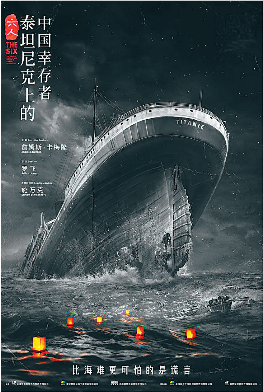
《六人：泰坦尼克号上的中国幸存者》海报。