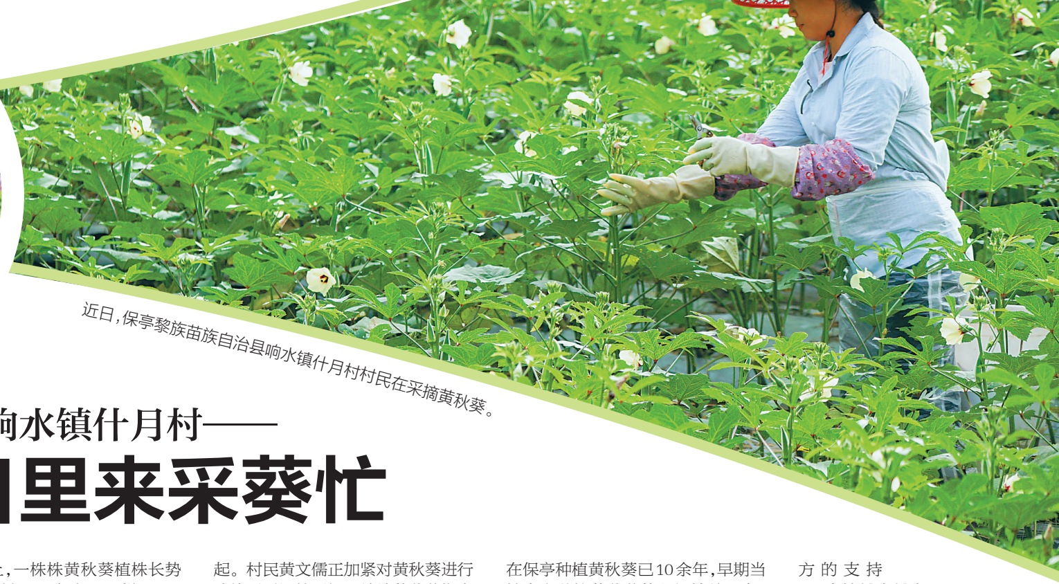
近日,保亭黎族苗族自治县响水镇什月村村民在采摘黄秋葵。