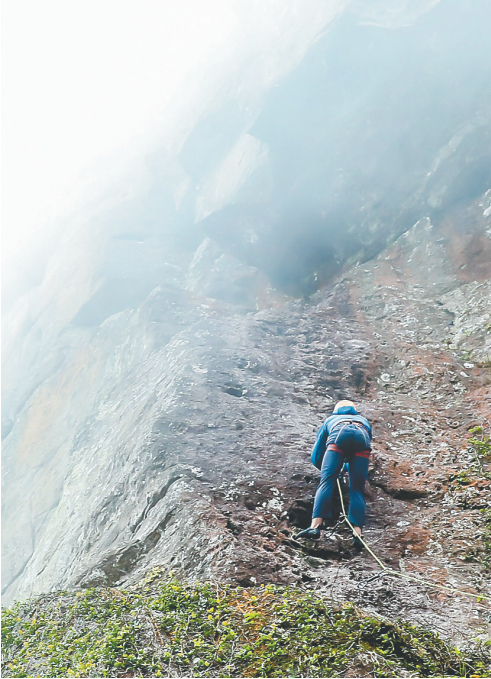
近日,户外运动爱好者在保亭黎族苗族自治县毛感乡攀岩。

据了解,保亭山地户外乡村游线路的规划,突出保亭的特色旅游资源,以热带雨林、石林溶洞、针状石林、雨林沟谷、黎族苗族民俗等为主要体验内容,配套了多个户外运动与乡村旅游相结合的旅游项目,丰富了保亭旅游产品类型,为该县发展全域旅游增添新动力。