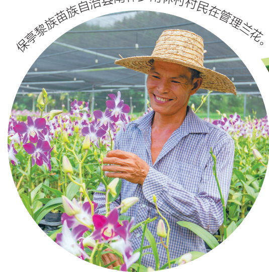
保亭黎族苗族自治县南林乡南林村村民在管理兰花。