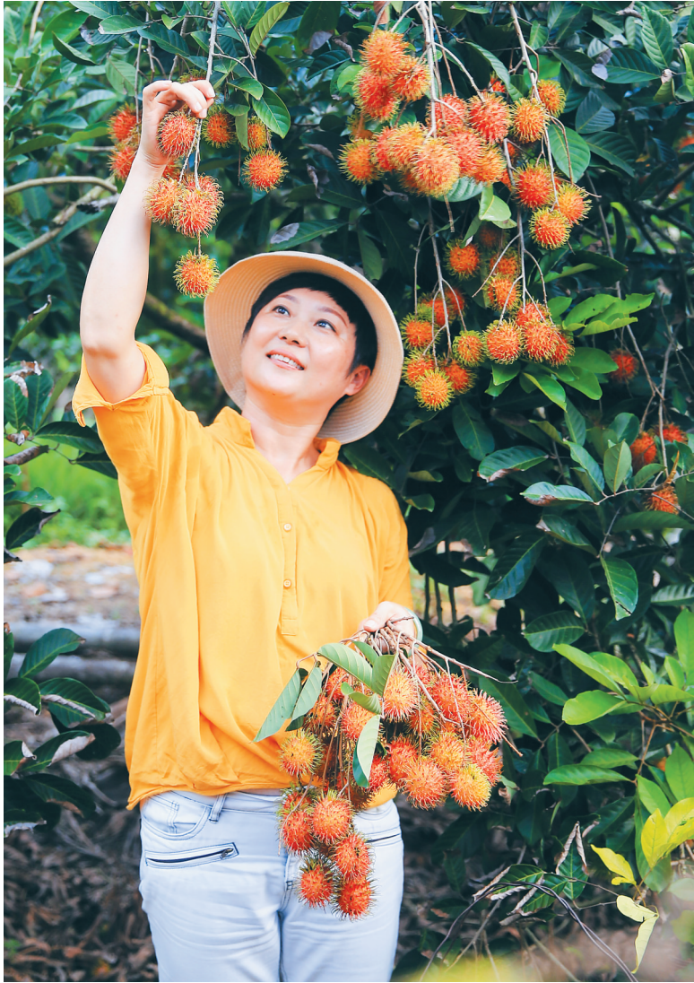
今年8月,保亭黎族苗族自治县举办乡村旅游红毛丹采摘季活动,图为游客在采摘红毛丹。