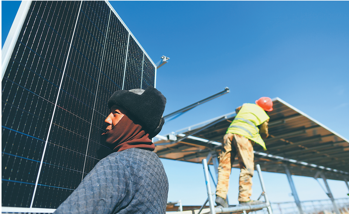
12月15日，在青海省海南藏族自治州共和县中国大唐集团有限公司30万千瓦竞价光伏项目现场，工人在进行安装作业。

情况向内蒙古自治区人力资源和社会保障厅发采访函，但该单位劳动关系处负责人表示，不愿意就此问题接受采访。 专家表示，对于低温津贴的发放，尽管有的地方出台相关规定或通知，但缺乏强制力；如果用人单位不主动，规定形同虚设。仅靠企业自觉，执行起来比较困难。 黑龙江大学社会学教授曲文勇说，低温津贴受重视程度不如高温津贴，还与冬季室外劳动者人数相对较少有关。比如，很多建筑工人在夏季高温天气下仍坚持作业，但在冬季气温比较低的地方，多数工程停工了。