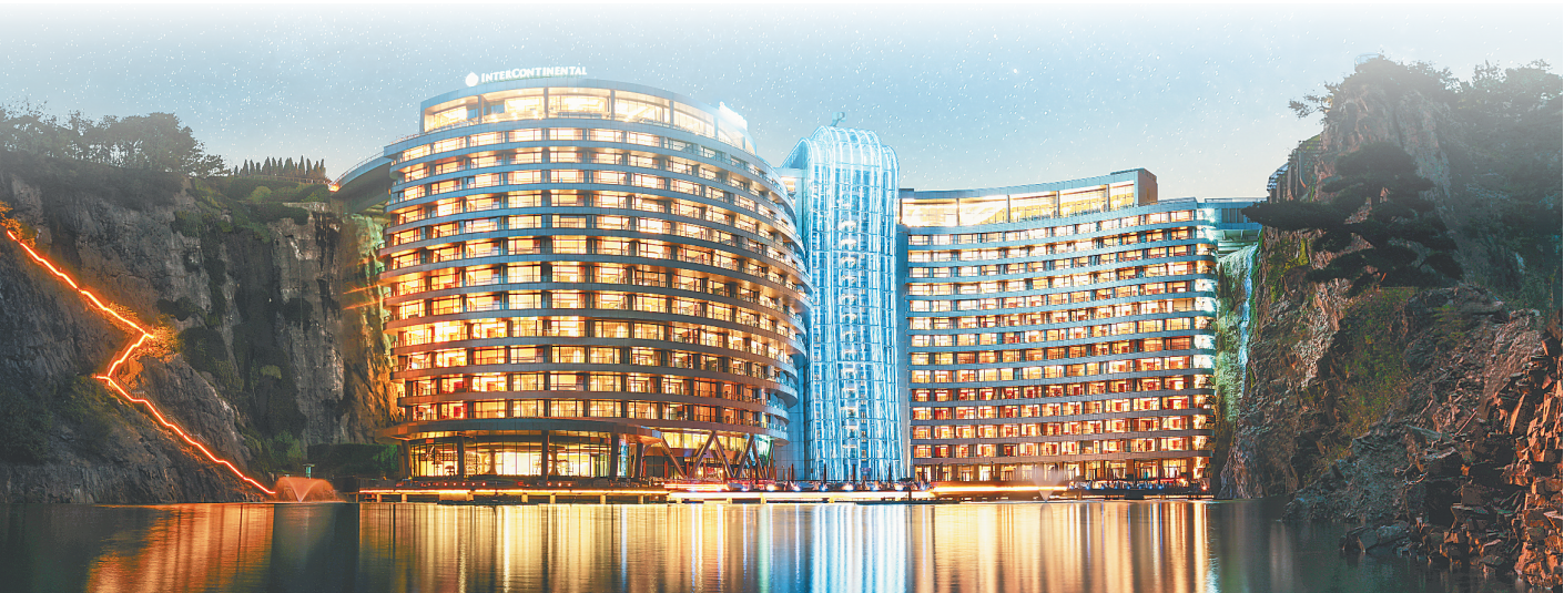
上海佘山世茂洲际酒店