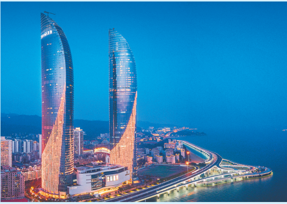
厦门世茂海峡大厦