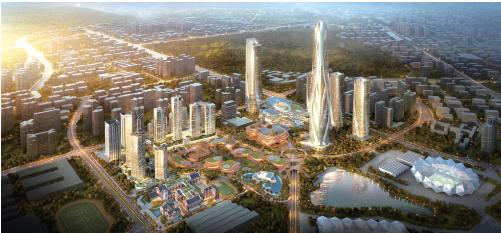
深圳世茂深港国际中心

际游艇产业集聚区。 “三区”：大三亚湾建设以“大型消费商圈+总部商务办公”为引领的总部经济核心区；海棠湾建设一站式国际休闲旅游度假目的地功能区；崖州湾布局深海科技城、南繁科技城和大学城。 “多点”：在城区外围沿绕城高速，布局多个特色功能组团。在全市总体布局中选取凤凰海岸、月川、东岸、海罗、红塘湾会展、水蛟智谷、半岭温泉、槟榔河、南丁南、深海南繁科技片区和铁炉港片区共十二个近中期实施单元，承担自贸港建设的关键功能，作为落实自由贸易营商环境、总部经济区和中央商务区建设的功能与空间需求的引爆点，以点带面促进城区功能组团的空間提升和产业结构调整，促进全市空间格局进一步优化。 其中，将位于主城核心区的迎宾路两侧确定为三亚总部经济及中央商务启动区，凤凰海岸、月川、东岸、海罗四个片区为首期实施建设单元。 世茂集团集中力量助力自贸港建设，努力将项目打造为三亚总部经济及中央商务区的封面代表。