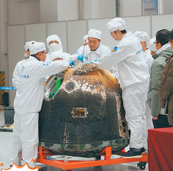
取 科研人员取出装有月球样品的容器。