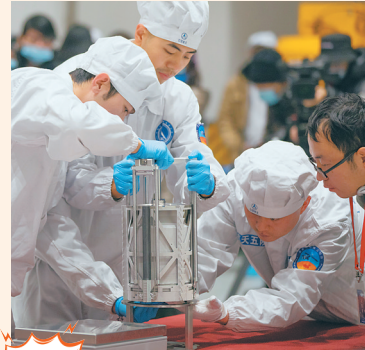
称 科研人员准备给月球样品称重。