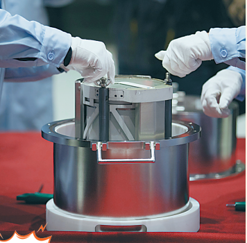
装 科研人员将月球样品容器装进特制容器。