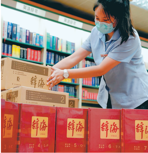
上海书城工作人员将《辞海》（第七版）摆放上架。