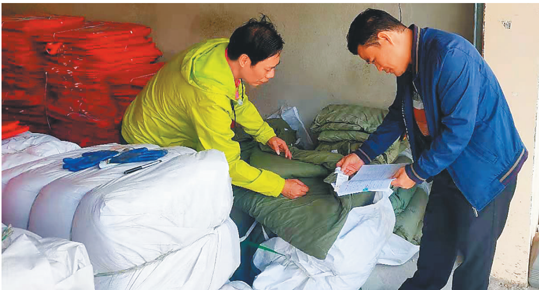
定安县民政局工作人员正在准备发放御寒物资。