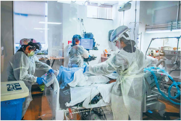
十一月十八日，护士在美国加利福尼亚州洛杉矶一所医院的重症监护室工作。

年4月前还将出现20多万死亡病例。 美国食品和药物管理局18日批准了美国生物技术企业莫德纳公司研发的新冠疫苗的紧急使用授权申请。这是第二款获批在美国紧急使用的新冠疫苗，被允许用于18岁及以上人群。本月11日，美药管局批准紧急使用美国辉瑞制药有限公司与德国生物技术公司联合研发的新冠疫苗。 美国约翰斯·霍普金斯大学发布的统计数据显示，截至美国东部时间19日晚，美国累计确诊病例已超过1760万例，累计死亡病例超过31.5万例。 （新华社华盛顿12月19日电 记者谭晶晶）