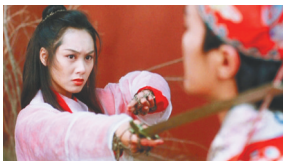
《大话西游之大圣娶亲》剧照

含泪的故事。因其搞笑的外在风格，更凸显了二人爱情之悲苦。当至尊宝变成孙悟空、转身而去的一刹那，许多人落下泪来。用情至深却追悔莫及，或许是那个年代的爱情片中最具戏剧化的表达。