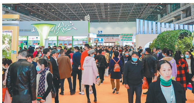
逛吃冬交会群众络绎不绝。