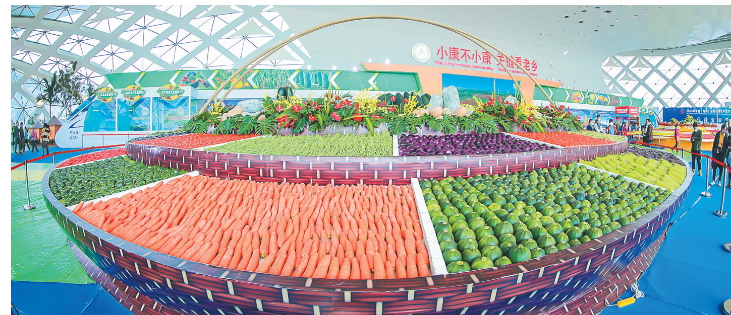
冬交会现场设置的大菜篮备受关注。