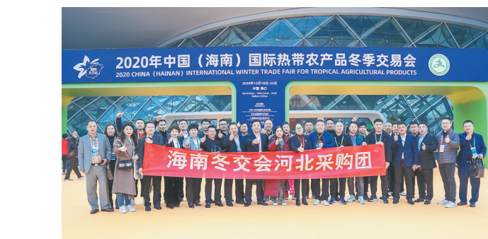
外省采购团青睐冬交会。

意向到公司基地参观考察洽谈合作事宜。琼海市委相关负责人表示,在省委省政府关怀和指导下,琼海市委市政府按照“人无我有、长短结合、农旅融合”的理念发展热带特色高效水果产业,实现农民增收、农村增美、农业增效。一是依托世界热带水果之窗项目,结合国家农业对外开放合作试验区建设,引进全球热带水果种质资源,研发培育优质热带水果品种,建成热带水果种苗繁育基地。二是结合琼海气候地理条件,因地制宜推广全球优质热带水果,打造热带水果一镇一品、一村一品,打响琼海热带水果品牌。三是结合琼海美丽乡村建设,打造热带特色水果美丽乡村集群,集示范、科普、采摘、定制、观光为一体,推动一二三产融合发展。