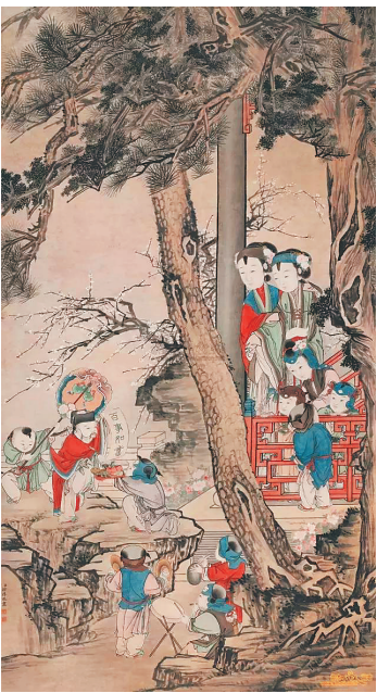
清代画家徐扬国画作品《万事如意立轴》。画中人们敲锣打鼓迎新春。

自古以来，元旦都极受中国人的重视，中国以农耕为文明之源，春播、夏种、秋收、冬藏，四季忙忙碌碌，年年周而复始，在这新旧相交之日，也该卸下一年的重担，好好休息一下了。于是，在这一天，人们安排了各式各样的娱乐活动，庆祝过去一年里的收获，也为新的一年祝福。