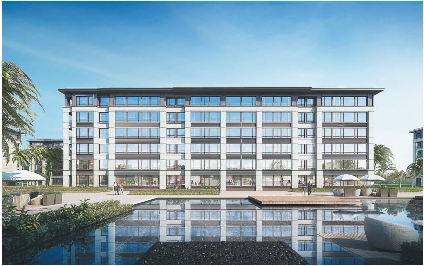
预售许可证号：【2020】海房预字（0091）号