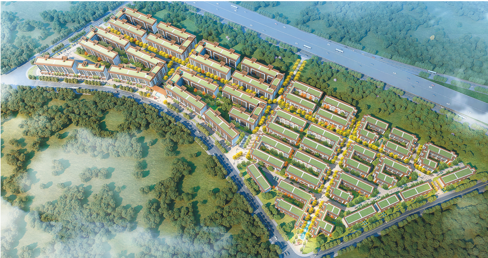
本组图片均为绿地空港GIC项目效果图。

绿地空港GIC拥有建筑面积约41平方米至98平方米的“吸金”旺铺，为临街独户设计，营业时间更自由，客流辐射面广，方便经营各种业态。其特色商业外摆和共享庭院的布局规划，轻松营造出开放与私密相结合的独特体验感。与此同时，临空经济区庞大客源将成为这里最稳定的消费群体。