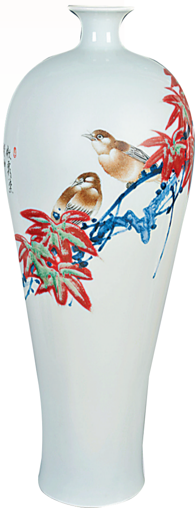
《傲霜染精神》 吴天麟 作