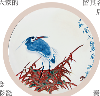
《春风一鹭》 陈军 作