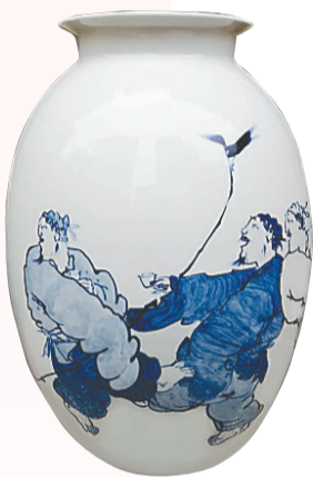
《清风酒韵》 曹春生 作

自幼喜欢绘画的吴天麟非常注重写生,所有的创作源泉都来源于生活,善于从自然界的细微观察中捕捉原生态的美。“海南是世界的海南,陶瓷是中国的国粹,世界通过陶瓷了解中国,这次景德镇的陶瓷艺术展来到海南,弘扬了中国传统文化。”