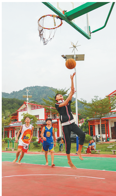
在白沙黎族自治县南开乡生态移民村银坡村,青少年在打篮球锻炼。

“十三五”期间,海南全面践行“全民健身”“健康中国”和“奥运争光”国家战略,围绕“增强人民体质、提高健康水平”目标,坚持改革创新、多措并举,以加大基础投入助推海南高质量发展、以全民健身助推全面小康、以竞技体育提升海南文化自信、以体育产业促进经济社会发展,全面完成了《海南省文化广电出版体育“十三五”发展规划》中的目标任务,为加快海南自由贸易港和“三区一中心”建设奠定了坚实基础。