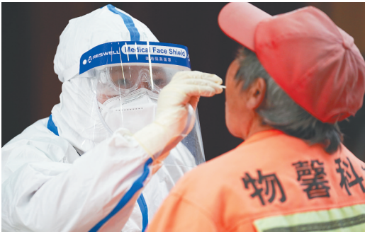
12月28日，在北京市顺义区核酸采样点，医护人员在进行核酸采样。

的应用，为包括老年人在内的人民群众提供更加安全便捷高效的交通出行支付服务。 通知要求，优化老年人打车出行服务。保持巡游出租汽车扬召电召服务能力，整合巡游出租汽车运力，提供电话预约或即时叫车服务；完善约车软件老年人服务功能，增设方便、适合老年人使用的“一键叫车”功能，鼓励有条件的网约车平台公司通过技术手段，为老年人提供优先派单服务；鼓励重点场所提供便捷叫车服务，在医院、居民集中居住区、重要商业区等场所设置出租汽车候客点、临时停靠点，依托信息化技术提供便捷叫车服务。