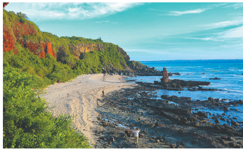
儋州峨蔓火山海岸风景无限。