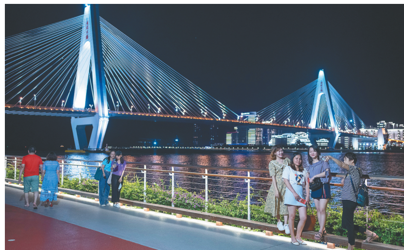
市民游客在海口湾休闲纳凉，世纪大桥夜景迷人。