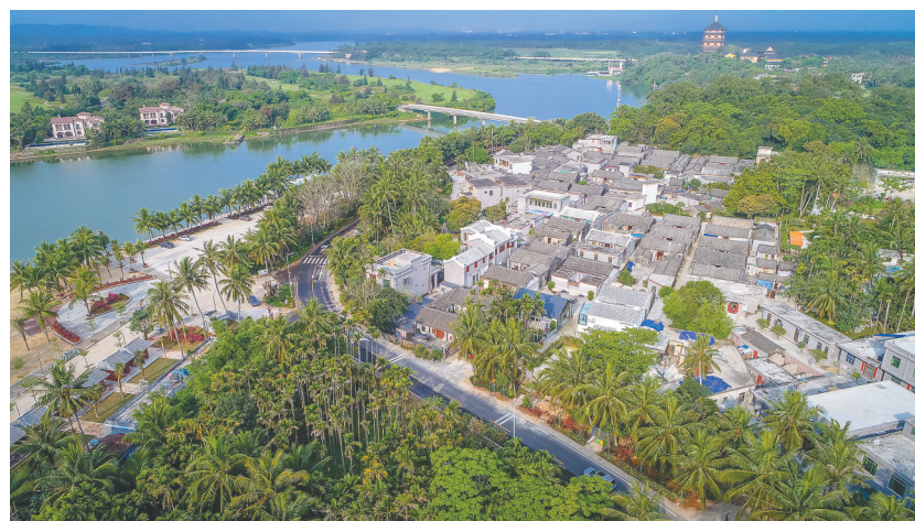
俯瞰琼海博鳌南强村田园景色。