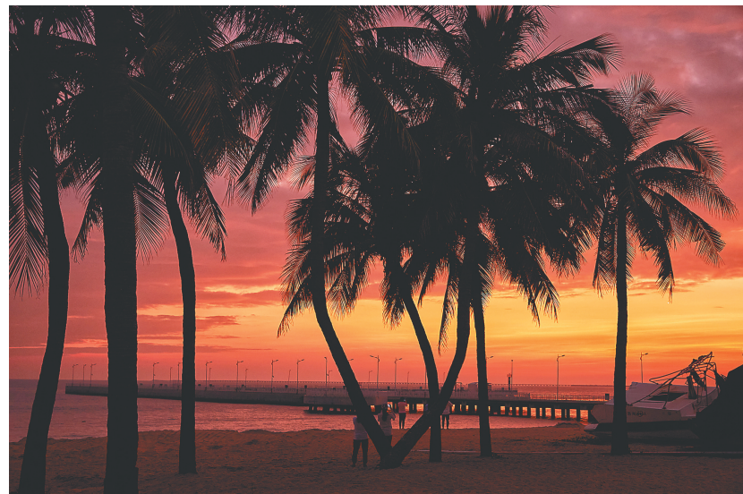
三亚天涯海角落日余晖。