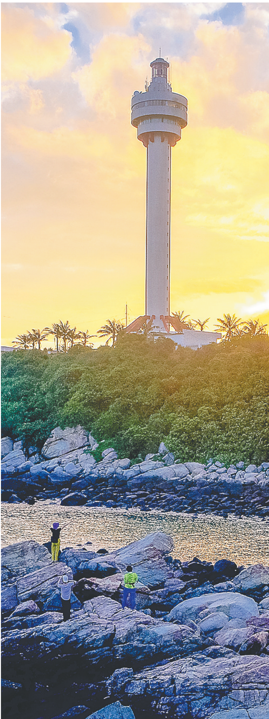
日出时分的文昌木兰灯塔。