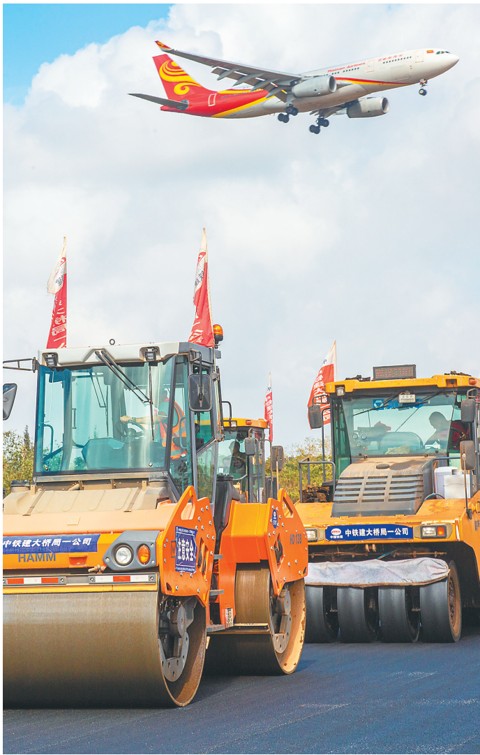
2020年12月14日,海口绕城公路美兰机场至演丰段公路机械轰鸣,不时有飞机从工地上空飞过。

2020年12月3日至4日,省委七届九次全会在海口召开,审议通过《中共海南省委关于制定国民经济和社会发展第十四个五年规划和二〇三五年远景目标的建议》。全会全面贯彻党的十九届五中全会精神,深入贯彻习近平总书记关于海南工作的系列重要讲话和重要指示批示精神,科学谋划部署海南“十四五”时期及未来长远发展、稳步推进自由贸易港建设,主题主线鲜明突出、目标要求科学务实、任务部署指向明确,为编制我省“十四五”规划纲要提供了依据和遵循,为海南自贸港建设注入了强劲动力。