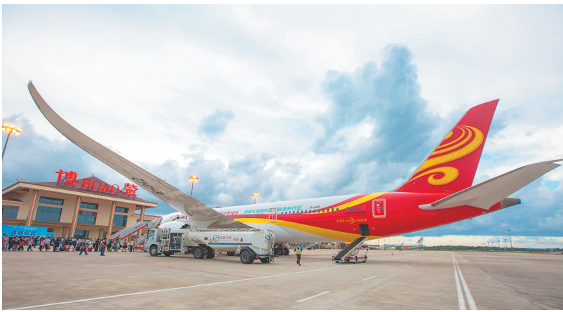
↑2020年7月28日，博鳌机场，从海南博鳌直飞北京的首架定期航班，乘客有序登机。首航采用“乐城号”波音787宽体客机。 ◆博鳌机场外景。